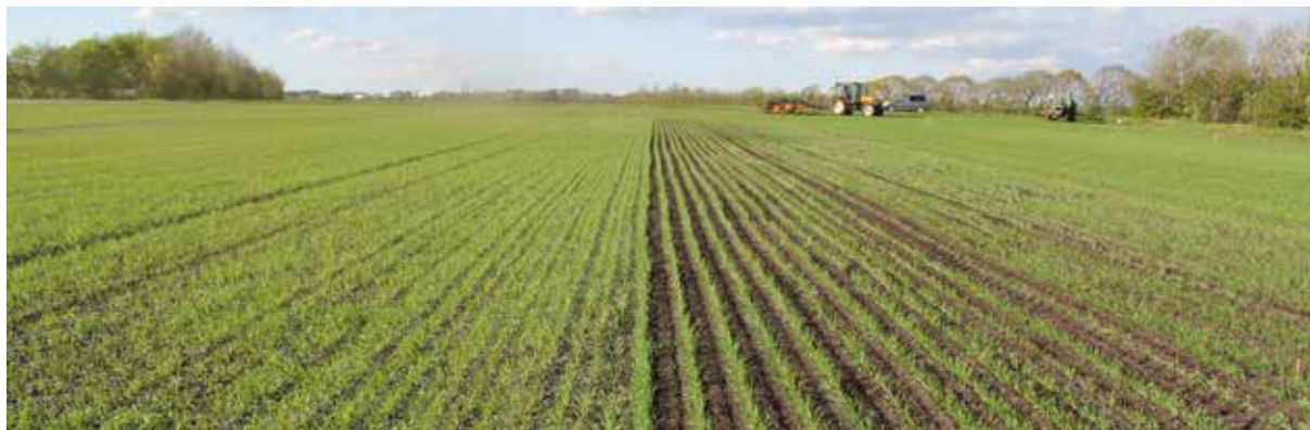
Forsøg med radrensning i vårhvede. Til venstre ubehandlet på 12,5 cm rækkeafstand og til højre radrenset på 25 cm rækkeafstand.

Mekanisk bekæmpelse af ukrudt har de seneste år været i fremdrift, godt hjulpet på vej af kamerastyrede radrensere, og kapaciteten og effektiviteten er dermed vokset. Der er i 2014 og 2015 lavet radrensningsforsøg i vårsæd. I forsøgene er forskellige strategier af traditionelle metoder med blindharvning og ukrudtsharvning sammenlignet